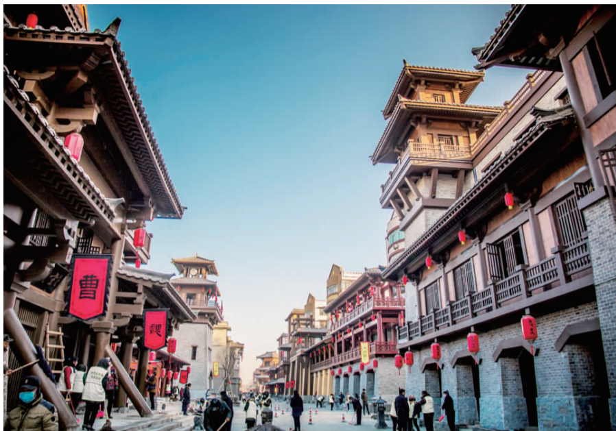
古色古香的曹魏古城。

云,策士如雨,昼携壮士破坚阵,夜接词人赋华屋④,豪情激宕,精魂永驻;铜雀花苑者,现君子之美也;取法坤宁后宫,山石错落,松竹掩映,花木多姿,四季常青,兼西湖⑤曼妙,天光云影,护城河水,碧波盈盈,鱼戏莲叶,荷花映红,燕穿柳丝,阵阵蛙声。诸多看点,串列其间,鳞次栉比,处处可谈,步移景异,忘返流连。噫!斯城也,伟哉美哉!